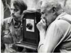
Josef Vörisek Josef Sudek , 1960s gelatin silver print 17,9 x 24 cm